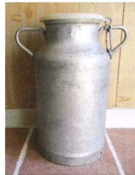
Le fameux bidon de lait en aluminium dur de 20 litres.

Puis le bon sens et la simplification du travail permirent dans les années 1960 de vendre directement le lait à ces laiteries en bidon de 20 litres, puis dans les années 1970 de livrer le lait collecté en tank qui était ensuite collecté avec des camions citernes.